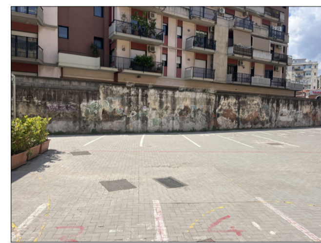
CONO DI VISUALE 5