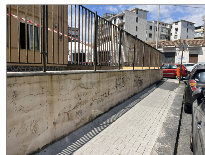
CONO DI VISUALE 2