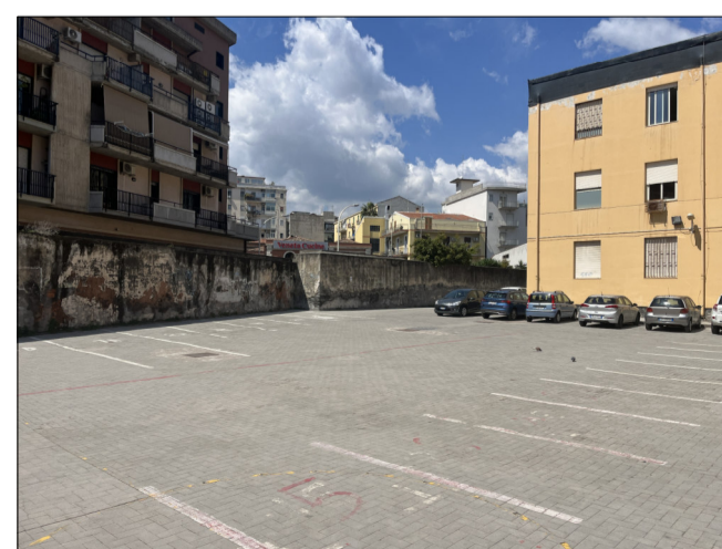
CONO DI VISUALE 4