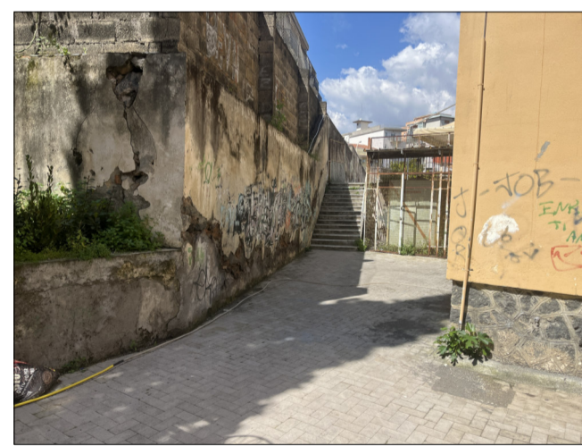
CONO DI VISUALE 3