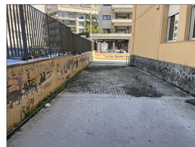
CONO DI VISUALE 6