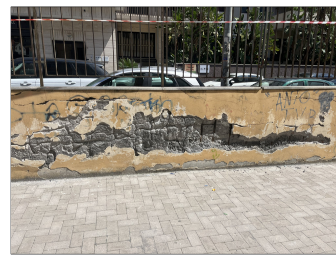
CONO DI VISUALE 1